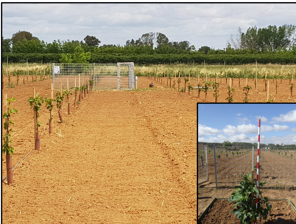
Plantación de higuera

Lisímetro de pesada. Dimensiones: 2,67 x 2,25 m y 1,5 m de profundidad